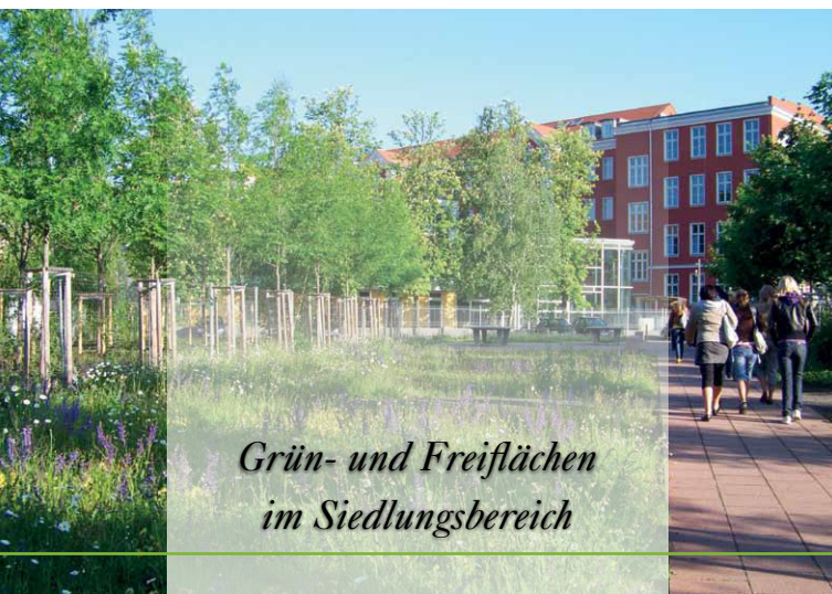
Grün- und Freiflächen im Siedlungsbereich

Das Bündnis „Kommunen für biologische Vielfalt“ will die Kommunen dabei unterstützen, dieses Potential für Mensch und Natur zu fördern.